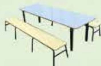
MESAS P/ REFEITÓRIO CÓD 720/721