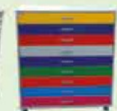
ARMÁRIO CARTOLINA C/ GAVETA - CÓD 369