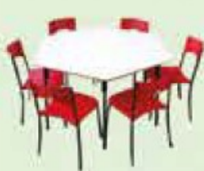
CONJ. SEXTAVADO CÓD 348