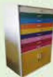
ARMÁRIO CARTOLINA ALTO