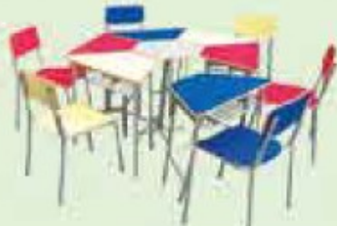
CONJ. SEXTAVADO CÓD 346