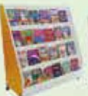
ESTANTE P/ REVISTA - CÓD 367 Disponível com portas brancas e cinza