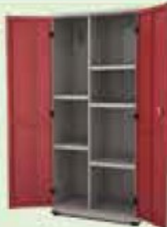
ARMÁRIO MULTIUSO DE AÇO