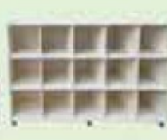
PORTA MOCHILA E NICHOS