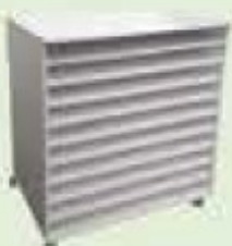
ARMÁRIO CARTOLINA MÉDIO - CÓD 711 Disponível com portas brancas e cinza