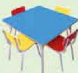
CONJ. QUADRADO CÓD 344