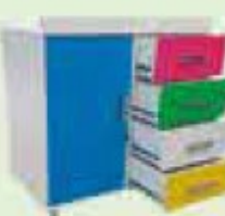
TROCADOR COM GAVETAS CÓD 715