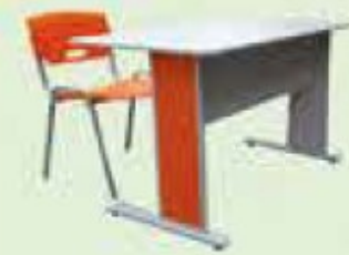
MESA PROFESSOR - CÓD 345