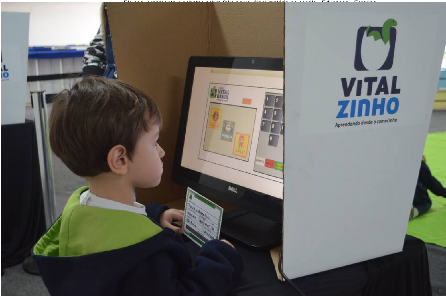
Simulação. Eleição com título e barulhinho de 'confirma'